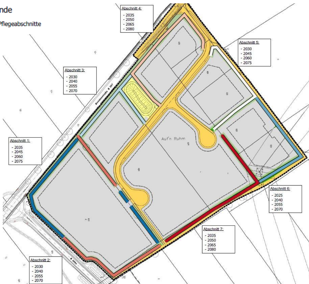
Abb. 2: Sieben Pflegeabschnitte mit Vorgaben der Jahre zur Durchführung der Knickpflege, Zeitraum 1.11. bis 28./29. Feb. (Kartengrundlage: PROKOM B-Plan Zeichnung, Stand: März 2019).