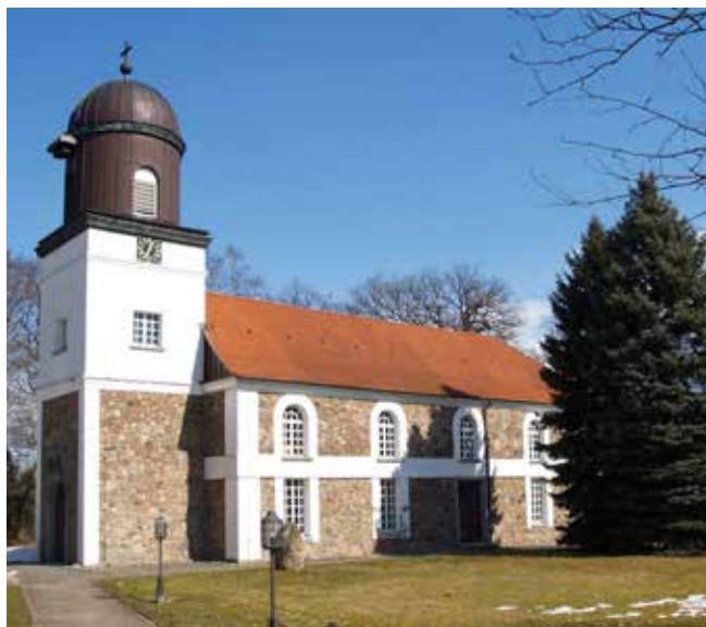
Kirche in Gülzow

Zuständig für die Gemeinden Grabau und Grove Kirchenbüro: Markt 5 b 21493 Schwarzenbek 04151 89230 www.kirche-schwarzenbek.de