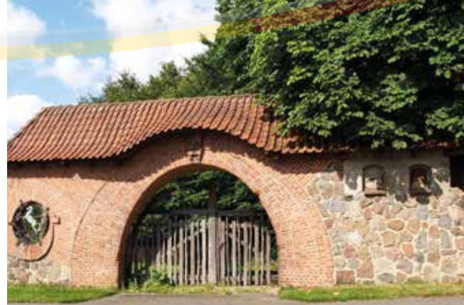
Tor in Gülzow

Grove hat etwa 270 Einwohnerinnen und Einwohner und liegt nur ca. drei Kilometer nördlich von Schwarzenbek, dessen Infrastruktur gerne von den Bürgerinnen und Bürgern genutzt wird. Da man vom Durchgangsverkehr weitestgehend verschont bleibt, lebt es sich sehr ruhig in Grove. Gleichzeitig benötigt man durch die Nähe zu